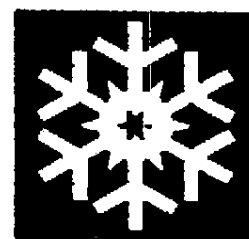
کاشی مقاوم در برابر یخبندان