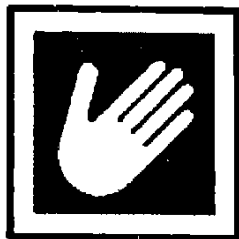
کاشی مناسب برای استفاده در دیوار