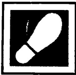
کاشی مناسب برای استفاده در کف